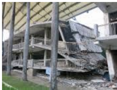
▲地震で崩れた建物をそのまま保存