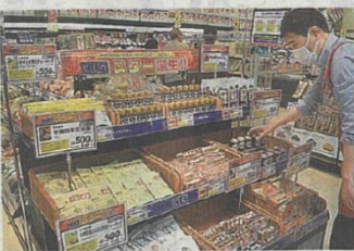
「あなたが選ぶ!じものスター誕生」の販売コーナー。16日午前、浜松市東区のMV浜松和田店

商品を販売する企画「あなたが選ぶ!じものスター誕生」を県内の21店舗で始めた。県伊豆、東部、中部、西部の各5〜6店で、それぞれの地元産品を30日まで販売する。人気商品は8月から、対象全21店で売ります。