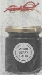
県西部の店舗で販売する浜産のフルベリーを使った無添加のジャム

マックスバリュ東海(MV東海、浜松市東区)は、これまで取り扱っていなかった地物商品を発掘して売り出す企画「あなたが選ぶ!じものスター誕生」を16日から30日まで県内の21店舗で実施する。県内4地域ごとに新