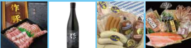
株式会社ヤマギファーム 「作豚ギフトセット」 ……10名様